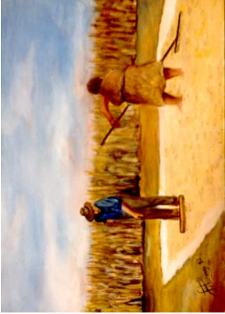
Stesura del granturco ( olio su tela 50 x 60 )