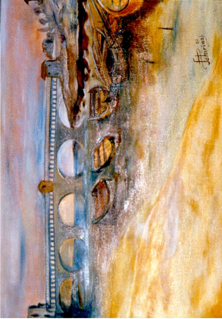
Ponte di Stein Sekkingen. ( olio su tela 50 x 60 )