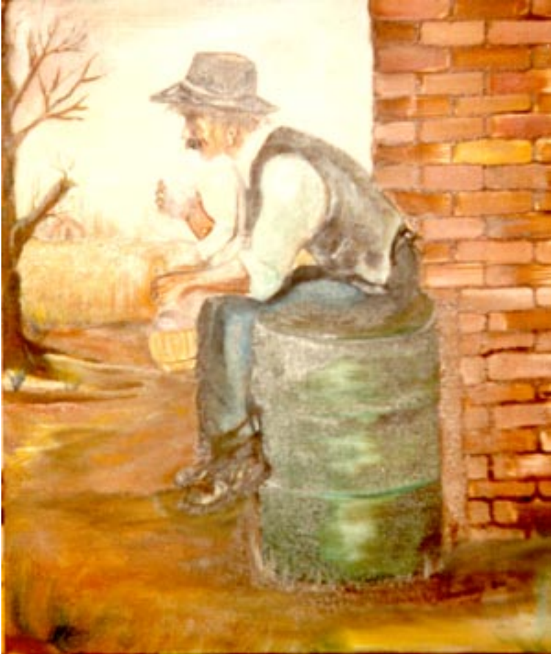
Pausa. ( olio su tela 40 x 50 )