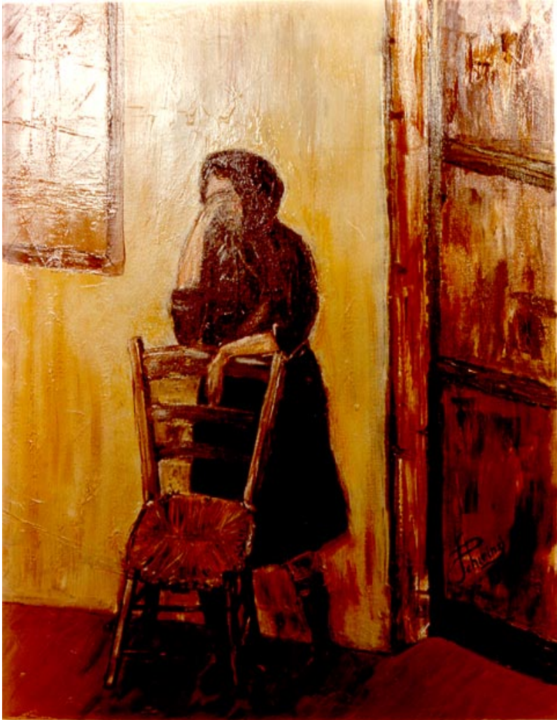
Vedova. ( olio su tela 50 x 60 )