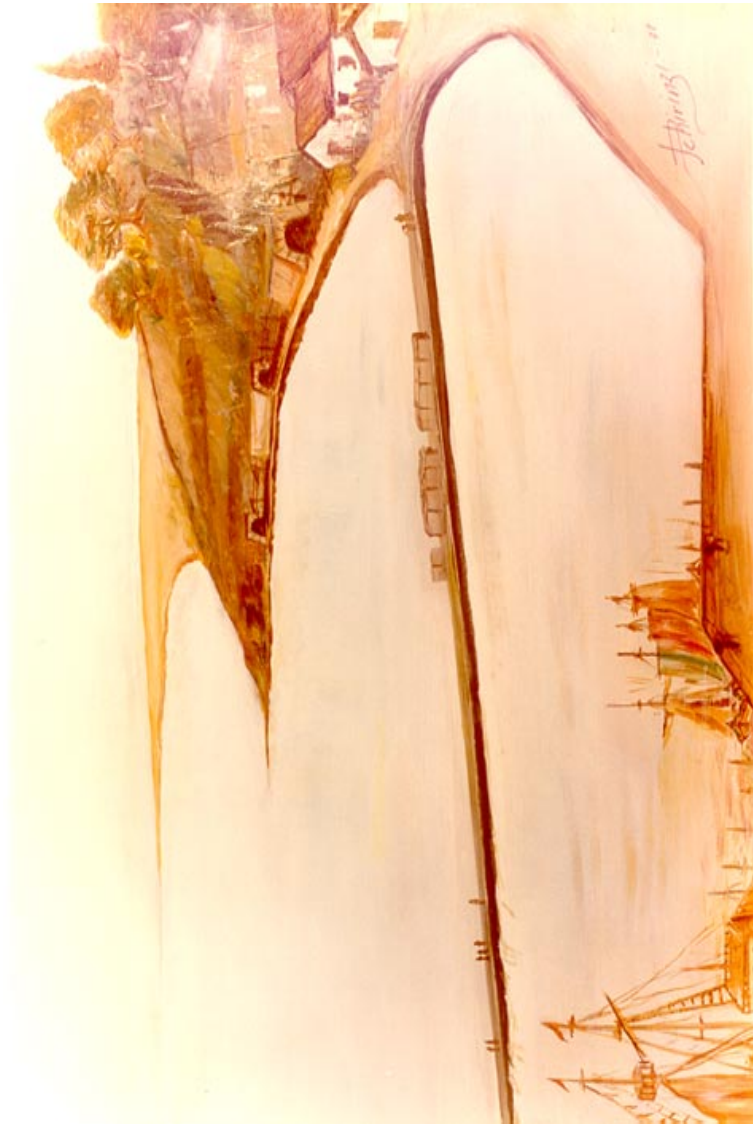
Molo di Ortona. ( olio su tela 60 x 80 )