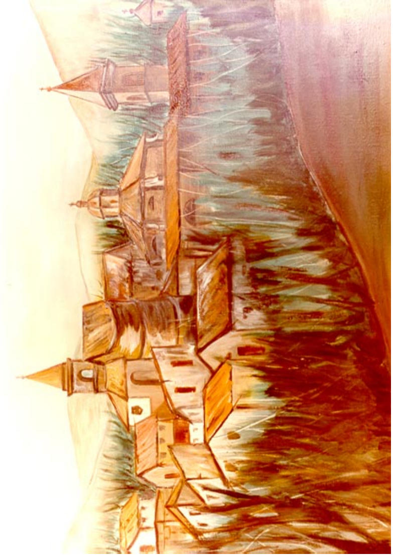
Popoli. ( olio su tela 60 x 80 )