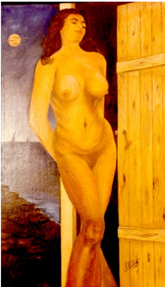
Notte di plenilunio. ( olio su tela 50 x 100 )