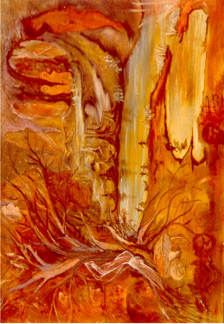
Deontologia dantesca. ( olio su tela 50 x 60 )