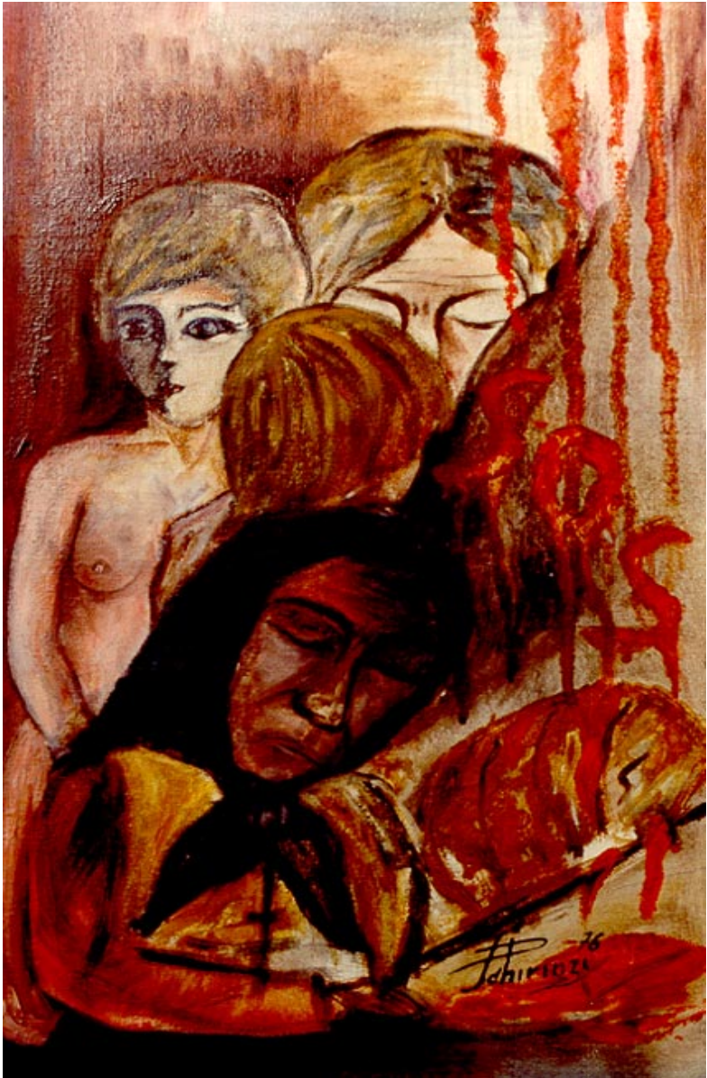
Cronaca. ( olio su tela 40 x 70 )