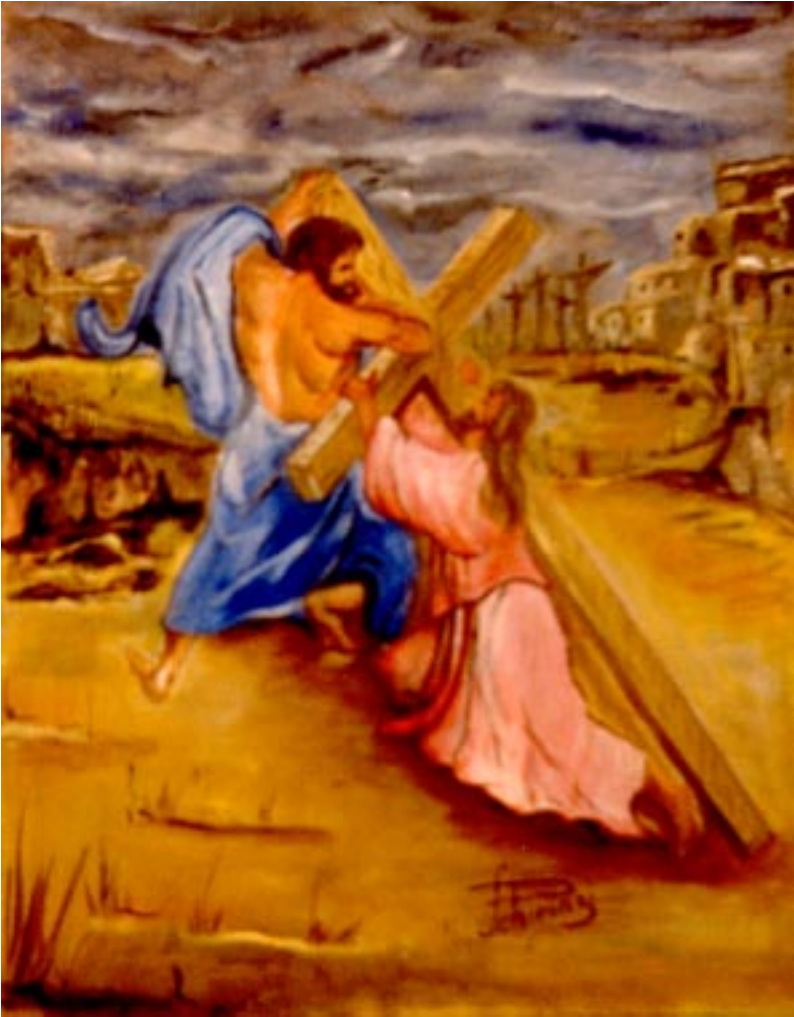
Calvario. ( olio su tela 50 x 60 )