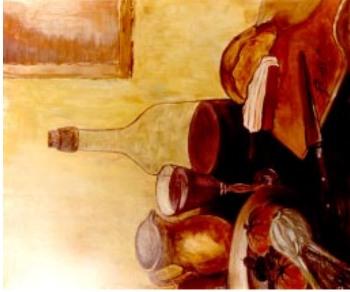
Natura morta 1. ( olio su tela 50 x 60 )