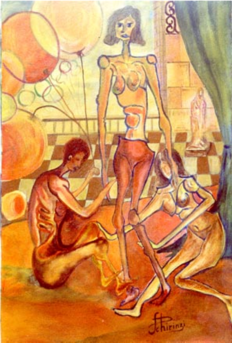
Libertà. ( olio su tela 50 x 70 )