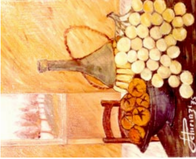
Natura morta 2. ( olio su tela 50 x 60 )