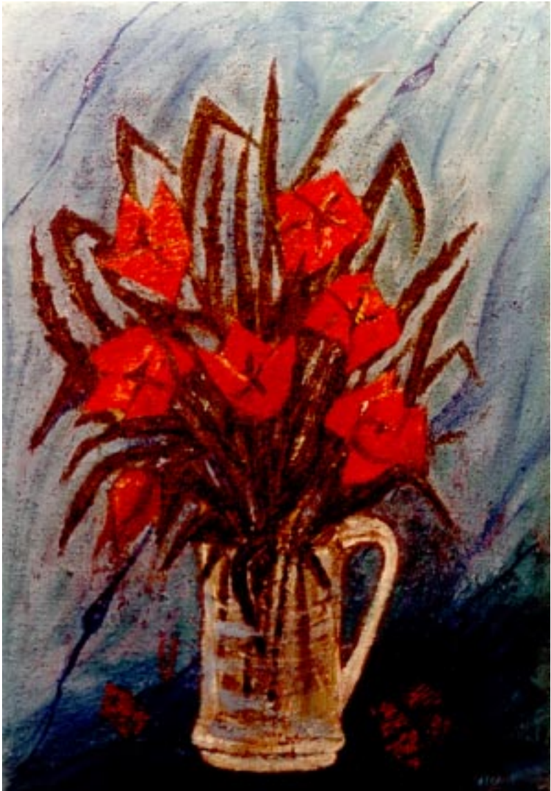
Papaveri. ( olio su iuta 50 x 70 )