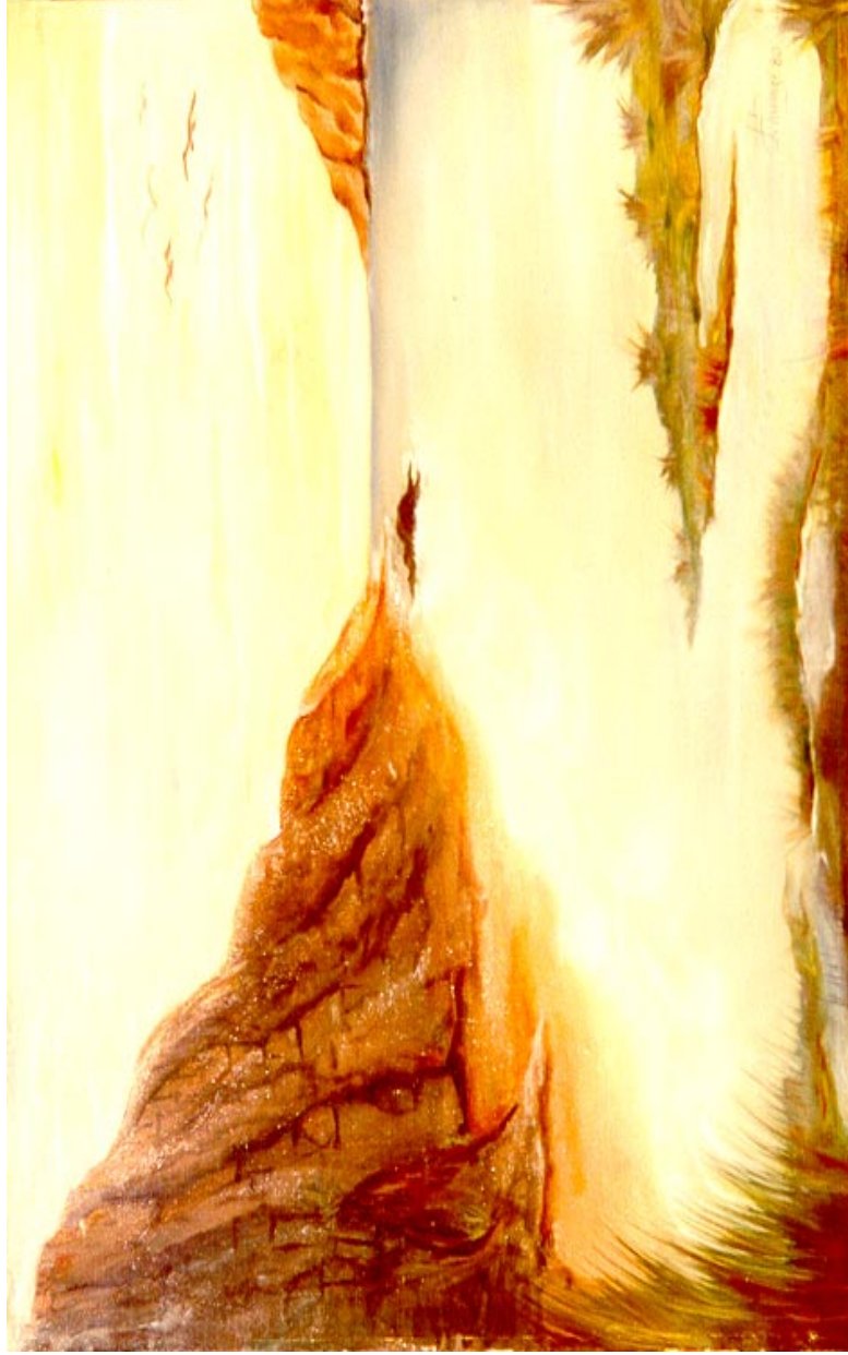
Paesaggio marino: Torre dell'Orso. (olio su tela 60 x 80 )